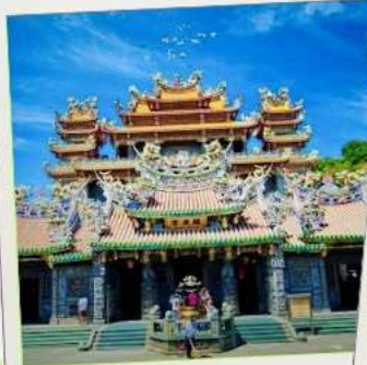
วัดกวนตู่