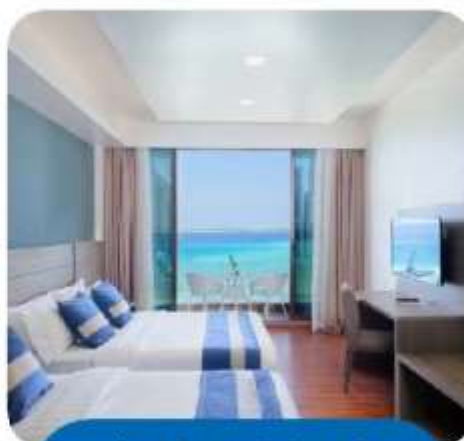
Premium Super Deluxe Room with Balcony and Seaview