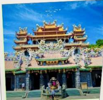
วัดกวนตู่