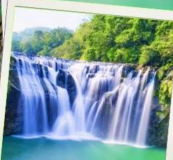
น้ำตกสีโอเฟิ่น