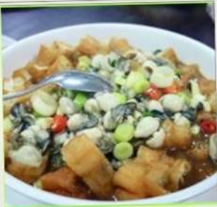
ถนนโบราณสีโอเฟิ่น