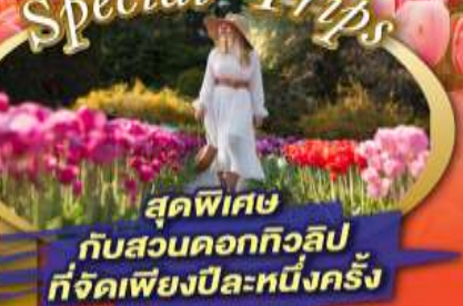
สุดพิเศษ กับสวนดอกทิวลิป ที่จัดเพียงปีละหนึ่งครั้ง