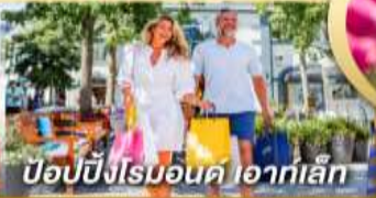
ป๊อปป์ปิงโรมอนด์ ไอทาลี