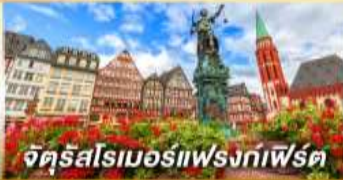
จัตุรัสโรเมอร์แฟรงก์เฟิร์ต