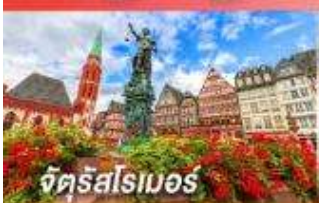
จัตุรัสโรเมอร์