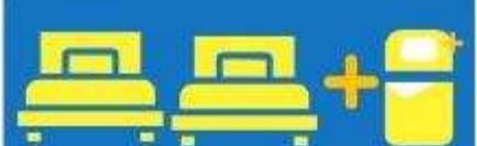
เตียง 3 ท่าน ที่นอนเสริม TRIPLE