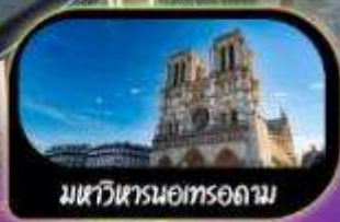
มหาวิหารนอทรอดาม