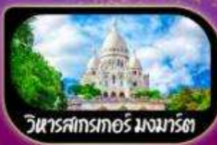
วิหารสากเรทอร์ มงมาร์ต