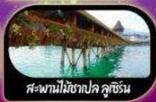
สะพานไม้อาปก ลูเซิร์น