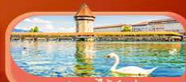
สะพานไม้ซังปก