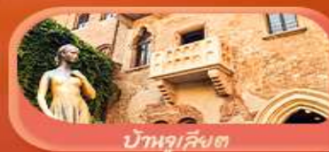
บ้านจูเลียต