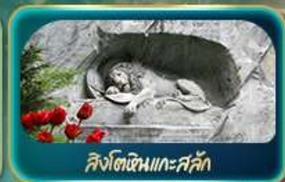
สิงโตหินแกะสลัก