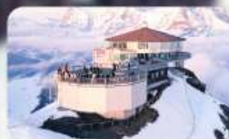
ทานอาหารที่ Piz Gloria ภัตตาคารที่หมุนได้ 360 องศา