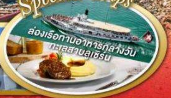
ล่องเรือทานอาหารกลางวัน ทะเลสาบลูซิเอร์