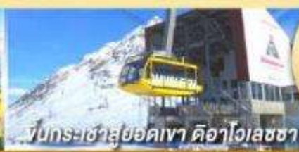
ขึ้นกระเช้าสู่ยอดเขา ดืออาโจเลซซา