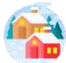
เมืองเซอร์แมท

เช้า บริการอาหารเช้า ณ ห้องอาหารของโรงแรม (11)