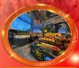
มือพิเศษ บุฟเฟต์นานาชาติ