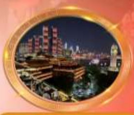
มือทำร้านอาหารวิวหลักล้าน