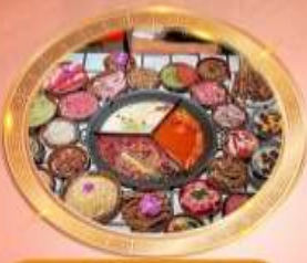
บุฟเฟต์หมีอโพลงซิ่ง