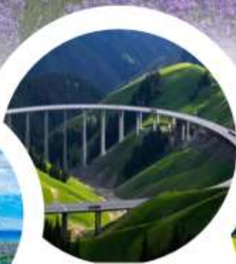
สะพานกว้อจื่อโกว