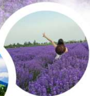
ทุ่งดอกลาเวนเดอร์