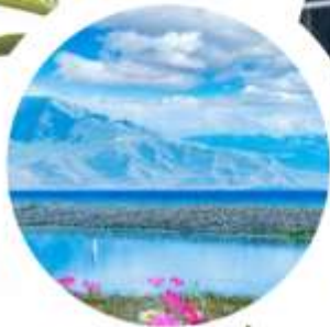
ทะเลสาบไซลีมี