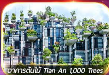
อาคารต้นไม้ Tian An 1,000 Trees