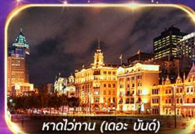
หาดไว่ทาน (เดอะ บันด์)

เที่ยวดิสนีย์แลนด์เต็มวัน (รวมรถรับ-ส่ง)