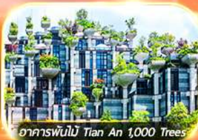
อาคารพินันที Tian An 1,000 Trees