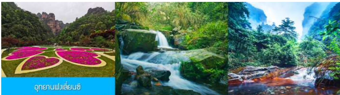
อุทยานฟงเลียนซี