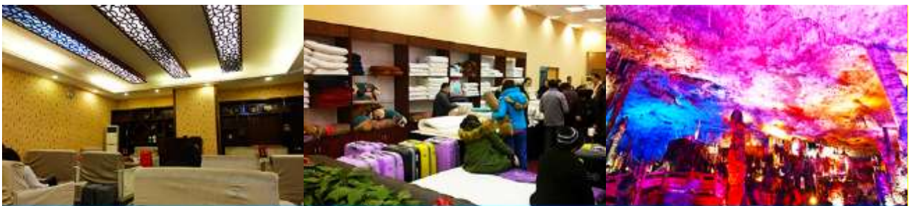
ศูนย์แพทยแผนจีน

อัตราค่าบริการสำหรับโปรแกรมเสริมการแสดงชุด The love Story of Wooden man and Fairy Fox ท่านละ 400 หยวน (หรือประมาณ 2000.-บาทขึ้นอยู่กับอัตราแลกเปลี่ยน) ระยะเวลาที่ใช้ในการเที่ยวชมการแสดง ประมาณ 3 ชั่วโมง รวมเวลา เดินทางไป กลับค่าบริการรวม ค่าบัตรเข้าชม ค่ารถรับ ส่ง และค่าน้ำดื่มของไกด์ท้องถิ่น