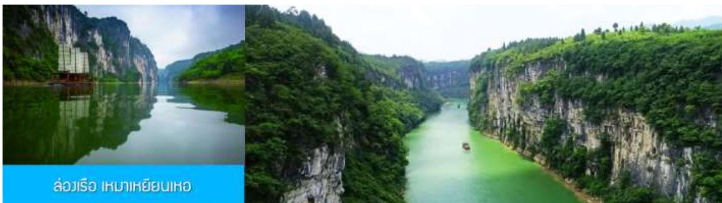
ล่องเรือ เหมาเหยียนเหอ