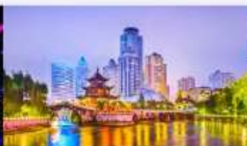
หอเจียเซียวไหลว