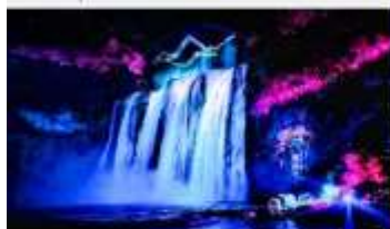
อุทยานน้ำตกหวงทิวซู