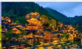
หมู่บ้านโบราณวูเจียงจ้าย