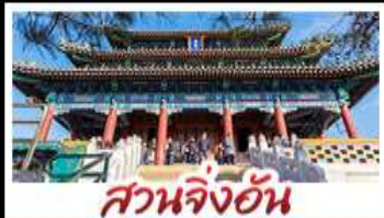
สวนจึงอัน