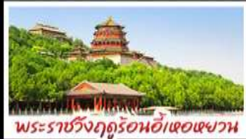
พระราชวังฤดูร้อนอี้เหอหยวน

ท่าแพงเมืองจีนค่ามจวียงกวน - พระราชวังฤดูร้อนอี้เหอหยวน สวนจึงอัน - วัดลามะ - โม่หลงร้านช้อป - โรงแรม 4 ดาว มือพิเศษ เปิดบิกทัง สุทึนงโถ MICHELIN GUIDE ร้าน TAO TAO JU