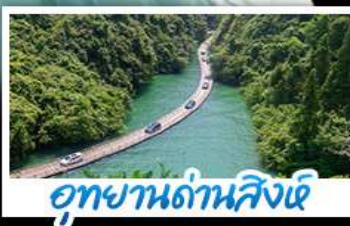
อุทยานด้านสิงห์