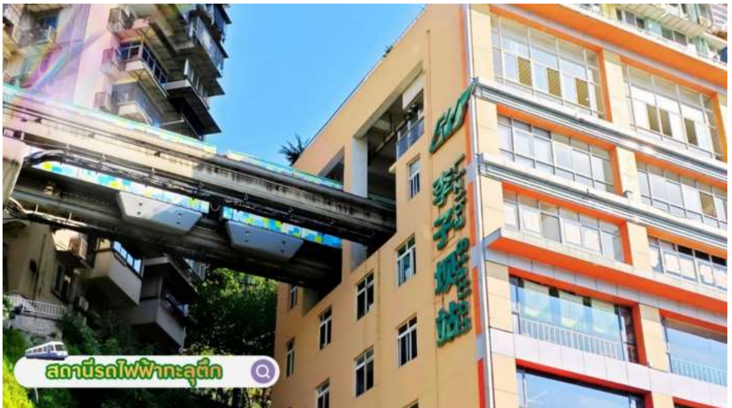
สถานีรถไฟฟ้าทะเลตุ้ก

นำท่านสู่ มหาศาลาประชาชนฉงชิ่ง (Chongqing Great Hall of the People) **ชมด้านนอก** คือสัญลักษณ์สำคัญของเมืองฉงชิ่ง เป็นอาคารขนาดใหญ่ที่มีสถาปัตยกรรมจีนอันงดงาม ผสมผสานศิลปะแบบราชวงศ์หมิงและชิง โดยได้รับแรงบันดาลใจจากหอฟ้าเทียนถาน (Temple of Heaven) ในปักกิ่ง ภายในจุคนได้กว่า 4,000 คน ใช้เป็นที่ประชุมสภาผู้แทนราษฎรและโรงละคร มีความโดดเด่นที่โดมกลางขนาดใหญ่สีแดง-เขียว ตั้งอยู่ใกล้กับจัตุรัสประชาชน และเป็นจุดหมายยอดนิยมที่นักท่องเที่ยวต้องไปเยือนเพื่อชมสถาปัตยกรรมและบรรยากาศเมือง