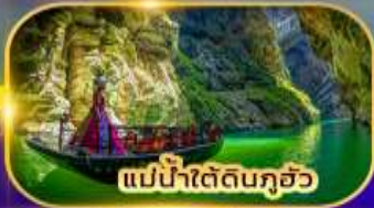
แม่น้ำใต้ดินกุอัว