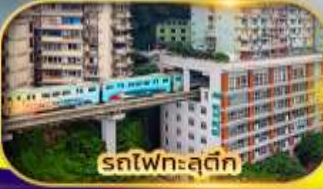
รถไฟทะลุติ๊ก