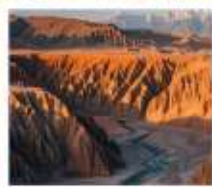
แกรนด์แคนยอนดูซานจือ