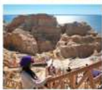
เขตบิศาจทะเล