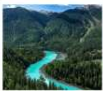
อุทยานคานาสือ