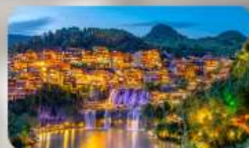
เมืองโบราณฟุทงเจิ้น