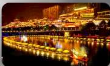
เมืองโบราณเซียนเอน