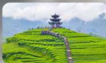
ภูเขาไร่ซาอูโตเจีย