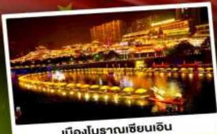
เมืองโบราณเซียนเ็น