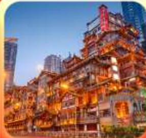
"ล่องเรือชมวิวหงหยาดัง"