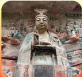
"ผาหินแกะสลักต้าจู้"