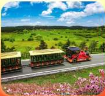
"อุทยานเขานางฟ้า"

บินตรงลงชิง • อุ่หลง หลุมฟ้าสะพานสวรรค์ • ระเบียงแก้ว • อุทยานเขานางฟ้า หงหยาดัง • นั้งรถไฟทะลุตึก • ล่องเรือชมฉางชิ่งยามค่ำคืน • ศาลาประชาคม (ด้านนอก) มรดกโลกผาหินแกะสลักต้าจู้ • เมืองโบราณสี่ปาตี้ • วัดหลิวฮั่น • ตึกตะเกียบ