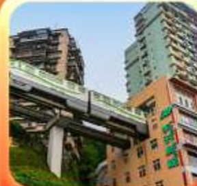
"นั้งรถไฟทะลุตึก"