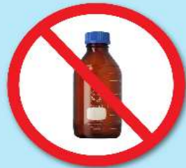
ขวดสารเคมี