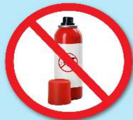
ขวดน้ำยา ฆ่าแมลง