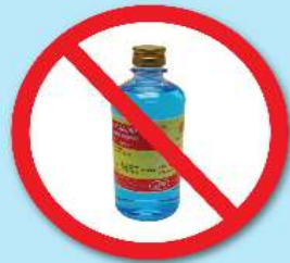
ขวดแอลกอฮอล์