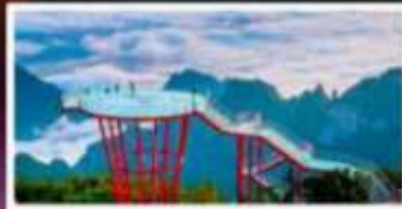
กุเวรา 7 ดาว