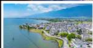
ทะเลสาบเอ๋อไห่