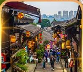
หมู่บ้านโบราณฉือชี่โจว