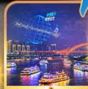
ล่องเรือแม่น้ำแยงซีเกียง