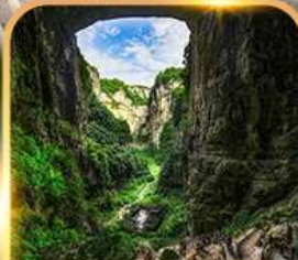
อุทยานหลุมฟ้า 3 สะพานสวรรค์