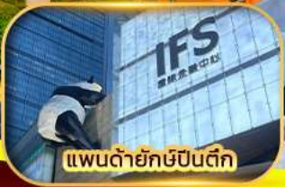
แพนด้ายักษ์ป็นตึก