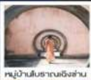
หมู่บ้านโบราณเชิงชัน