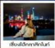
เชียงใหม่คลาสสิกไนท์