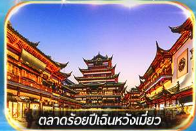
ตลาดร้อยปีเงินหวงเมี่ยว

ถ่ายรูปชมสวนออร์ทันด์ , เชคอินหาดไว่ทาน, วัดพระหยกขาว อิสระช้อปปิ้งถนนนานกิง POPMART FLAGSHIP STORE