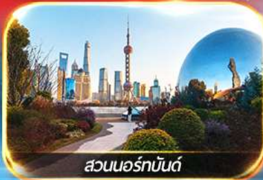
สวนออร์ทันด์