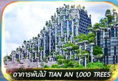
อาคารพื้ไม้ TIAN AN 1,000 TREES