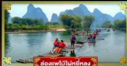
ล่องแพไม้ไผ่หยี่หลง