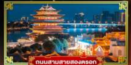
ถนนสามสายสองตอรอก