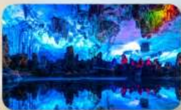
ถ้ำลุย้อ