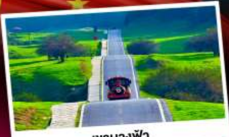
เขานางฟ้า

อุทยานหลุมฟ้าสามสะพานสวรรค์ มรดกโลกเขานางฟ้า ซุปบึงถนแดนแดน