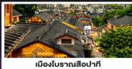
เมืองโบราณสี่ปาที้