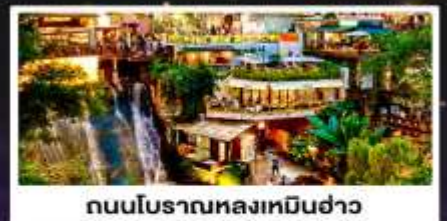
ถนนโบราณหลงเหมินฮ่าว