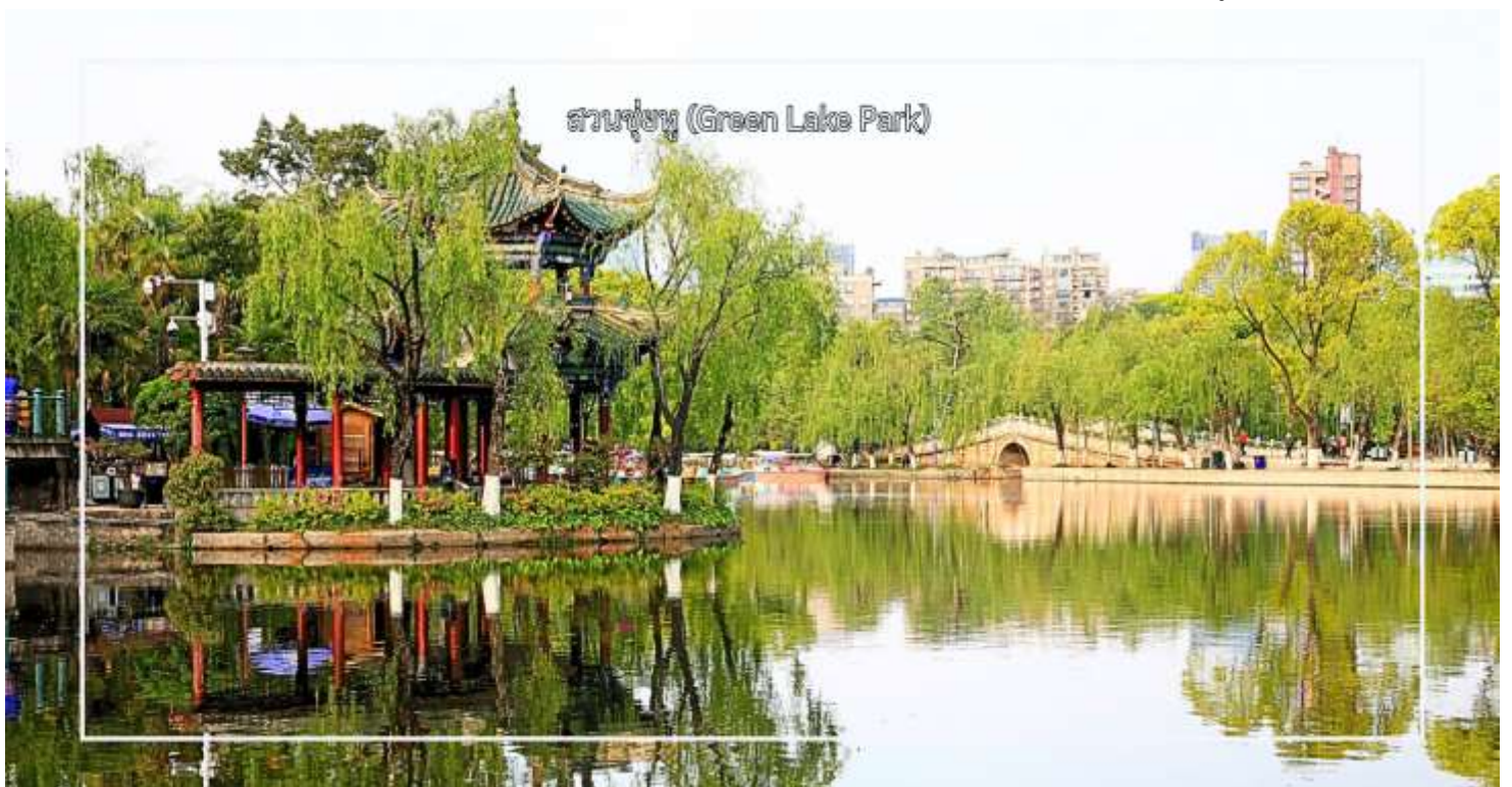
สวนชู่หู (Green Lake Park)

จากนั้นนำท่าน ชมทัศนียภาพ สวนชู่หู (Green Lake Park) เป็นสวนสาธารณะใจกลางเมืองคุนหมิงที่มีชื่อเสียงและได้รับความนิยมอย่างมาก โดดเด่นด้วยทะเลสาบสีเขียวมรกตที่โอบล้อมด้วยต้นไม้ร่มรื่น และบรรยากาศผ่อนคลาย เหมาะแก่การพักผ่อนและเดินเล่น สวนแห่งนี้เป็นศูนย์รวมวิถีชีวิตของชาวคุนหมิง นักท่องเที่ยวสามารถชมกิจกรรมท้องถิ่น สัมผัสบรรยากาศธรรมชาติ และถ่ายภาพความสวยงามของสวนในทุกฤดูกาล