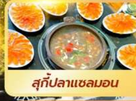
สุกี้ปลาแซลมอน