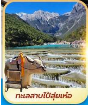
ทะเลสาบโป๋สุ่ยเหอ