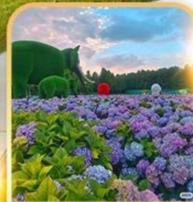
ดอกไม้ตามฤดูทงกา