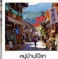
หมู่บ้านไปซา