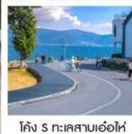
โค้ง S ทะเลสาบเอ๋อไห่

“นั่งรถไฟชมวิวกุหลาบหิมะมังกรหยก” สุดพิเศษ คาเฟ่ YUN DI AN ฟรี!! เครื่องดื่ม ท่านละ 1 แก้ว