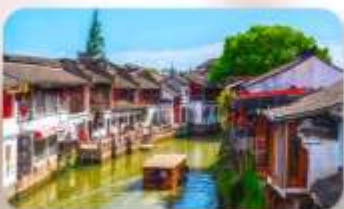
เมืองโบราณจูเจียวเจียว