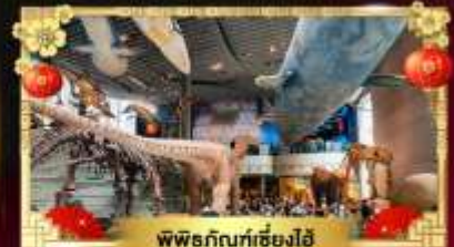
พิพิธภัณฑ์เซี่ยงไฮ้