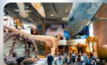
พิพิธภัณฑ์เซี่ยงไฮ้