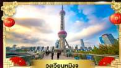
วงเวียนทหิงจู