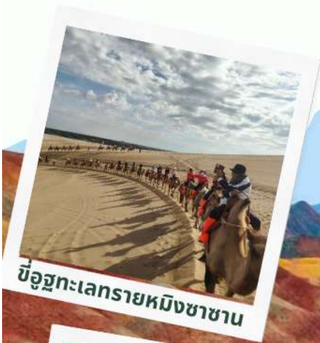
ขี่อูฐทะเลทรายหมิงซาซาน