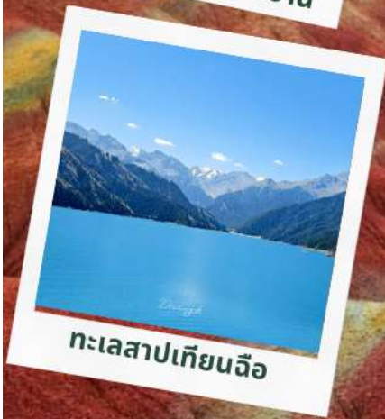
ทะเลสาปเทียนฉือ