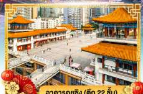
อาคารคุยซิง (ตึก 22 ชั้น)