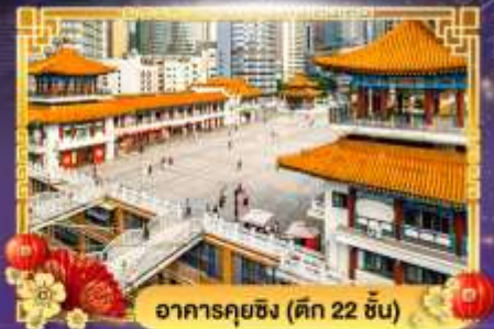
อาคารคุยซิง (ตึก 22 ชั้น)