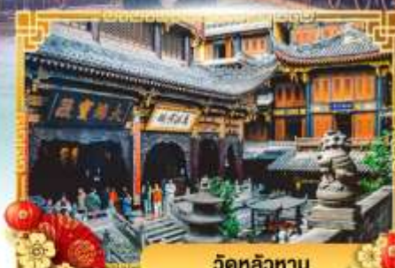
วัดหลัวหลาน