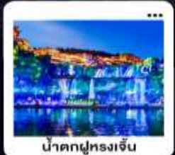
น้ำตกฝูหลงเจิน

"มหัศจรรย์...จางเจียเจีย" | ดินแดนแห่งขุนเขาและสายน้ำ "เขากิเยนเหมินซาน" | ประตูล่องเรือ...ท่าทวยศรึกธา 999 ชั้น | บั้งรถไฟความเร็วสูง สัมผัสความสวยงามตระการตา "อุทยานเขาวตาร" | ส่องล่องกลางขุนเขา...ดั่งภาพฝันในห้วงนภเสียดฟ้า | ช้อปปิ้ง POPMART "เมืองโบราณ" ฝูหลง" หยุตเวลา ณ เมืองบนม่านน้ำตก... | "เฟิ่งหวง" ส่องเรือชมชีวิตริมแม่น้ำถิวเจียง "นครฉางซา" ปิดท้ายความทันสมัย