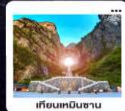
เกียนเหมินซาน