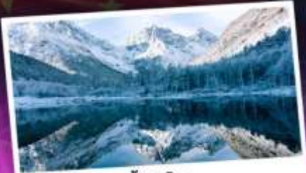
บี้ฝิงโกว

เทือกเขาแอลป์เมืองจีน "ภูเขาสีครุณี" ชมความสวยงามของอุทยานบี้ฝิงโกว