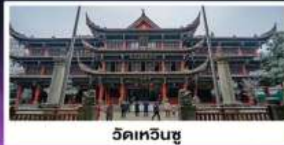
วัดเหวินซู