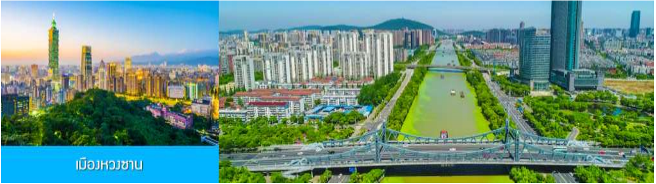
เมืองหวงชาน