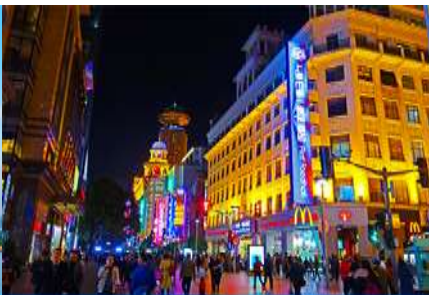
ถนนคนเดินหนานจิงลุ่