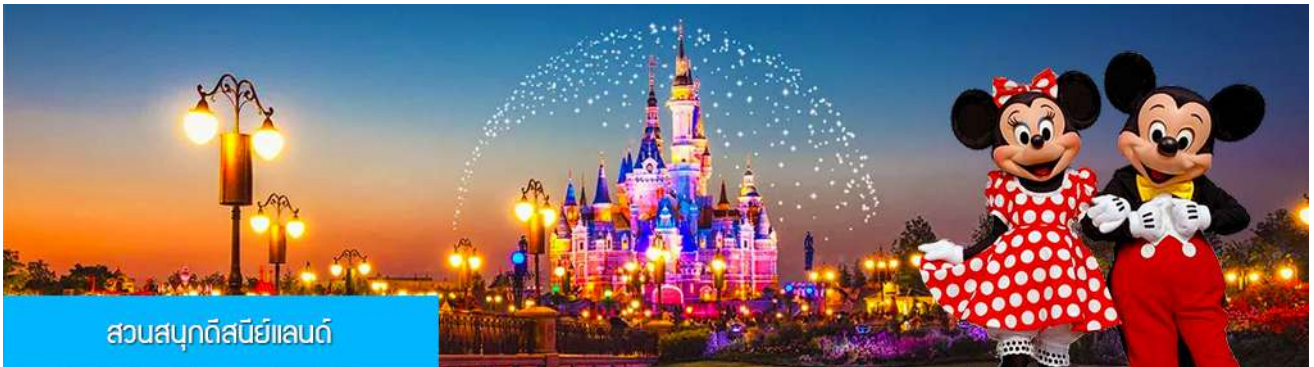
สวนสนุกดิสนีย์แลนด์

พักที่ โรงแรม Tongpai Hotel or Fangyi Hotel 4* หรือเทียบเท่าในเมืองเชียงใหม่