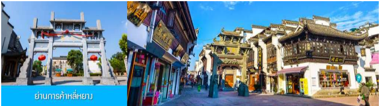
ย่านการค้าลี่หยาง

เที่ยง อีระอาหารมื้อกลางวัน ( ท่านสามารถเลือกชิมอาหารพื้นเมืองในระแวกโรงแรมได้ตามอัธยาศัย )