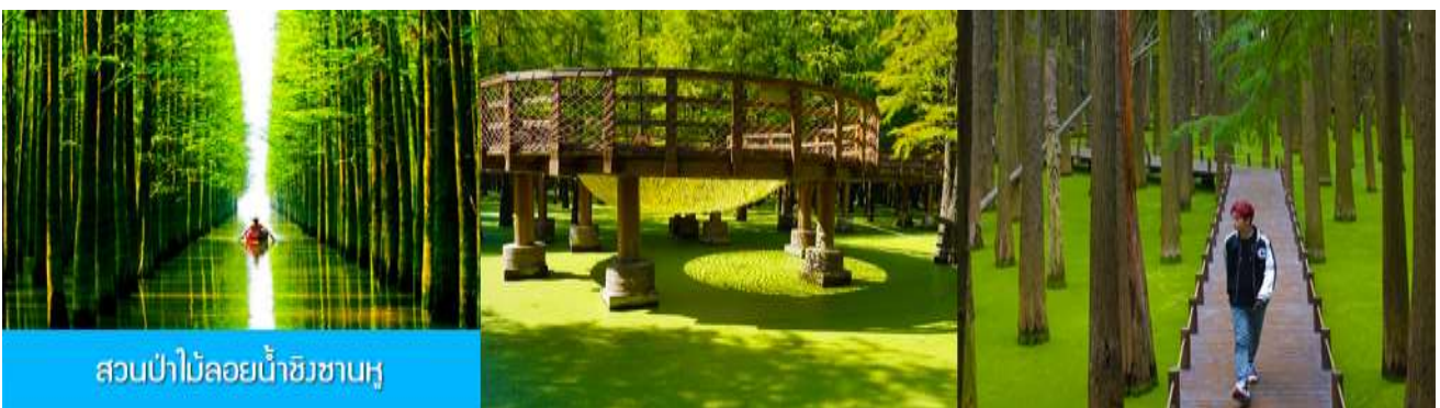
สวนป่าไม้ลอยน้ำชิงชานหู

พักที่ PAIJING HOLIDAY HOTEL โรงแรมระดับ 4 ดาวท้องถิ่น หรือเทียบเท่า เมืองหวงชาน