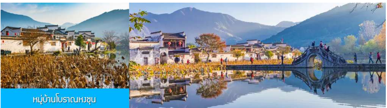
หมู่บ้านโบราณหงซุน

ไกด์ท้องถิ่นนำเสนอโปรแกรมทัวร์เสริมบัตรชมการแสดงชุด ตำนานรักเมืองซ่ง 宋城千古情 การแสดงภายในโรงละครที่ดีที่สุด และได้รับรางวัลมากที่สุดของประเทศจีน.....อัตราค่าบริการสำหรับโปรแกรมเสริม ท่านละ 380 หยวนหรือ 1,900 บาท ใช้เวลาประมาณ 90 นาที ค่าบริการรวม ค่าตัวชมการแสดง ค่ารถบัสรับ และค่าน้ำทิพย์ของไกด์ท้องถิ่น