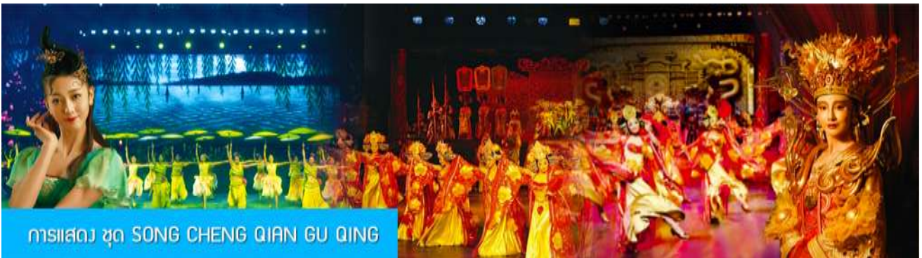
การแสดง ชุด SONG CHENG QIAN GU QING

พักที่ โรงแรม Tongpai Hotel or Fangyi Hotel 4* หรือเทียบเท่าในเมืองเซี่ยงไฮ้