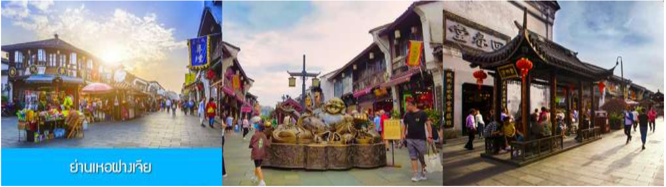
ย่านเหอฝางเจีย