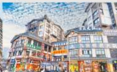
หมู่บ้านโบราณฉือซีไช่

*ทางบริษัทฯ ขอสงวนสิทธิ์ในการสลับโปรแกรมทัวร์ตามความเหมาะสมขึ้นอยู่กับสถานการณ์หน้างาน โดยคำนึงถึงผลประโยชน์ของลูกค้าเป็นสำคัญ