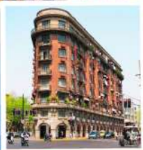
ถนนอุคัง