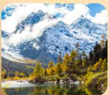
“ปี่ฝิงโกว”

ชมธรรมชาติ 2 อุทยานขึ้นชื่อ อุทยานภูเขาสี่ดรุณี + อุทยานปี่ฝิงโกว สะพานหนานเฉียว • ถนนคนเดินไถ่กู่หลี่ + ซุนซีลู่ + Pop Mart • ดงเจียวจี้