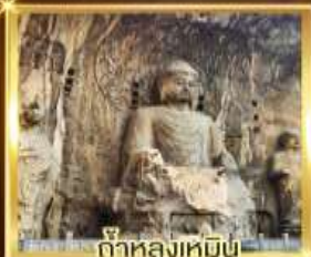
ถ้ำหลงเหมิน