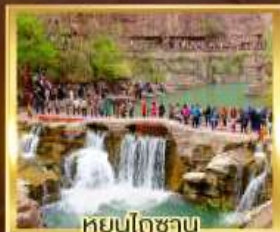
หยุนโกซาน