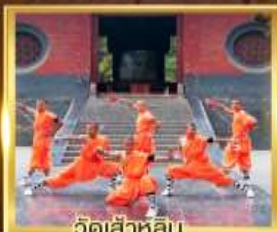
วัดเล่าหลิน