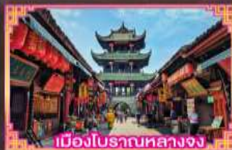
เมืองโบราณหลางจง