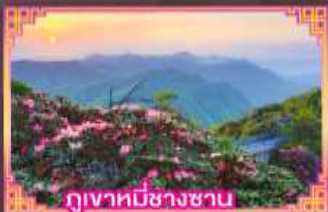
ภูเขาที่มีซากซาน